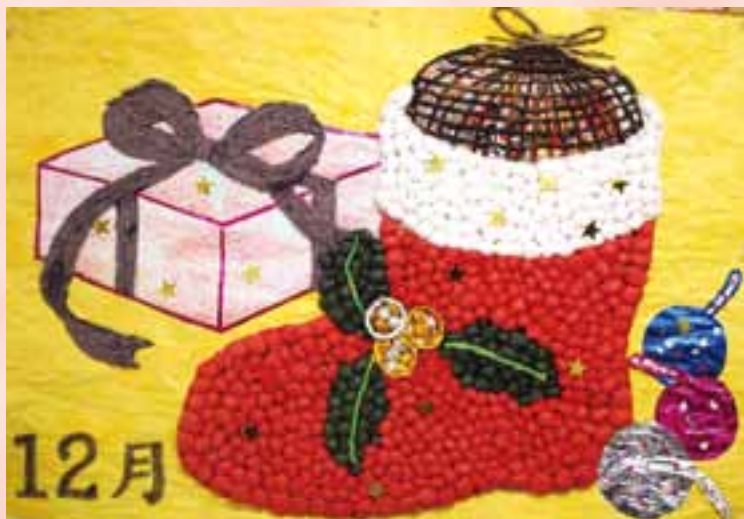
通所リハビリ利用者さんの作品 「プレゼント」