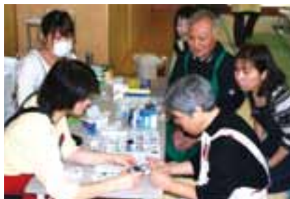
お食事前に血糖測定。食事だけではなく、体の変化についても勉強します。