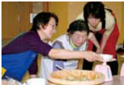
盛り付けにもひと工夫！ちゃんと量を測りました。