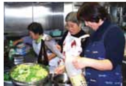
3チームに分かれ、それぞれ担当する料理を調理しました。レシピを見て…どんな工夫のヒントが隠されていますか？