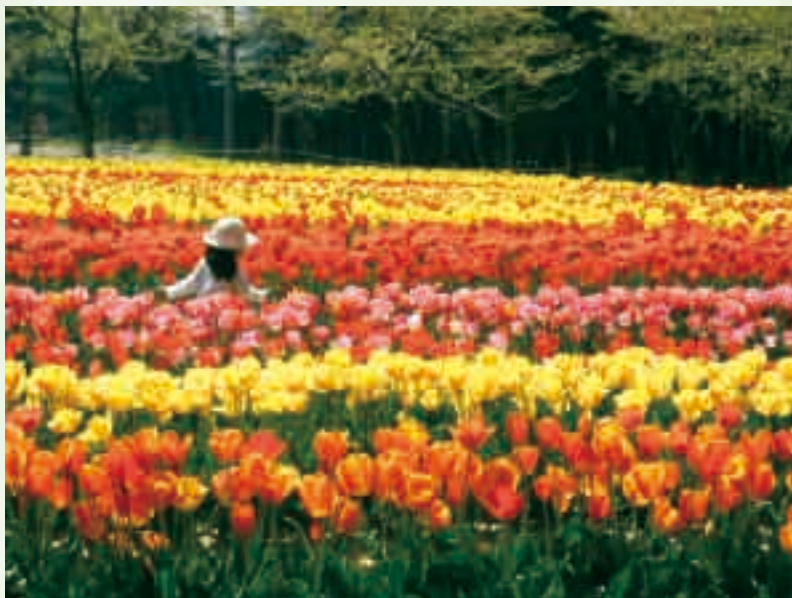
撮影場所：いこいの村庄内