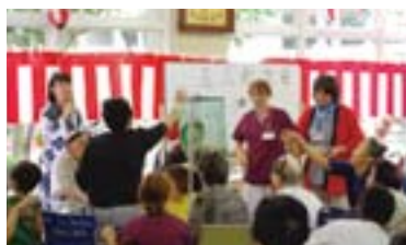
玉入れ大会優勝は3階西チーム!