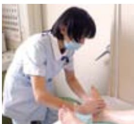
フットマッサージ