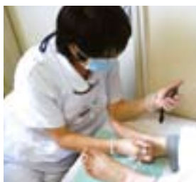
音叉によるテスト