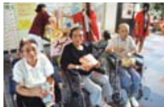
宝釣りゲームでゲット!

当病棟では、潤いのある入院生活を送っていただけ、生活の場所が違ってご家族との交流を深めていただきたいたいという思いから、季節の行事や誕生会など様々なイベントを開催しております。その中でも大きいイベントのひとつに療養病棟夏祭りがあり、今年も8月7日(日)に3階東、4階東病棟と合同で開催しました。