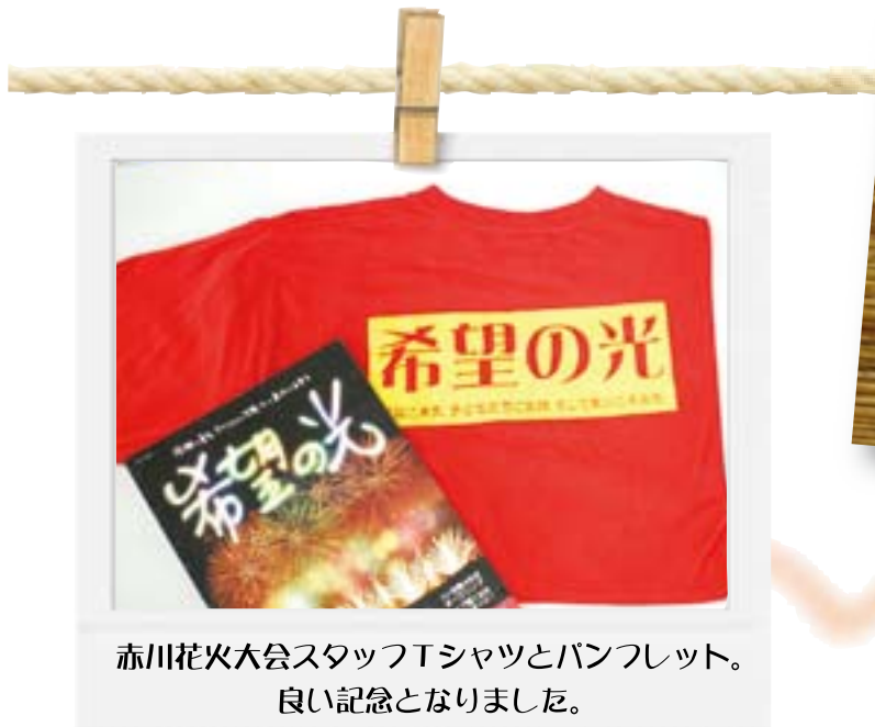
赤川花火大会スタッフTシャツとパンフレット。 良い記念となりました。